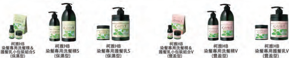
柯雅HB 染髮專用洗髮精& 護髮乳小包裝組合S (保溼型)