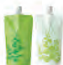
思柏絲森林柔直燙髮霜N (染後髮・輕微自然捲適用) 1劑/2劑(過氧化氫型)各 NET.400g