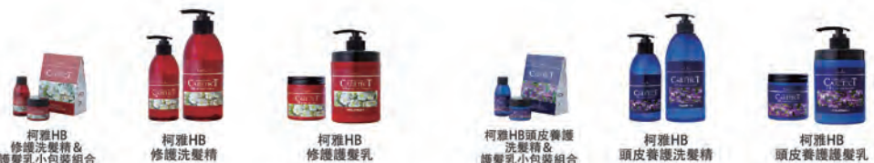
柯雅HB 修護洗髮精& 護髮乳小包裝組合

最適合染後頭髮，含有血色素配方的弱酸性洗髮精。加水分解玻尿酸成分，讓染後髮能得到溫柔的保護，並維持鮮艷髮色。針對不同髮質，有保溼型(S)及豐盈型(V)可供選擇。在染髮後最初的兩三回使用染髮專用洗髮精&護髮乳，可抑制褪色，並同時去除多餘的污垢及不適的味道，為染髮後最適的專用產品。