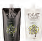
玢美森活感縮毛矯正燙髮劑SH [超強力型] 新生髮，嚴重自然捲適用(粗硬髮・疏水性髮質) 1劑/2劑各NET.400g

忠實呈現顧客心目中理想髮質的新概念縮毛矯正燙髮劑。能從髮根至髮尾確實拉直秀髮，呈現出令人忍不住想觸摸的柔滑觸感及光澤度。也是娜普拉所追求的「直順髮」的起始目標。