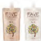
玢美森活感縮毛矯正燙髮劑N [一般型] 燙後髮(髮中~髮尾)/輕微自然捲適用 1劑/2劑各NET.400g