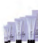
iM上質修護法(居家養護) β保溼型 インプライム モイスチャートリートメントベータ NET.15g×2 220元/NET.80g 440元/NET.200g 880元