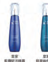
皇家 藍鑽賦活精露

皇家藍鑽賦活精露 NET.125mL 950元 / 皇家翡翠絢色精露 NET.125mL 950元