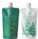
思柏絲森林柔直燙髮霜H (新生髮・嚴重自然捲適用) 1劑/2劑(過氧化氫型)各 NET.400g

思柏絲森林柔直燙髮系列是一款能讓髮芯至髮尾賦予柔軟、潤澤質感的全新感受直燙髮劑。藉由植物性天然保濕劑及乳油木果油、草本精華等天然萃取成分，保濕成分，完成柔軟且自然的效果。