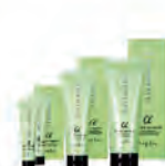
iM上質修護法(居家養護) α柔順型 インプライム スムーストリートメントアルファ NET.15g×2 220元/NET.80g 440元/NET.200g 880元