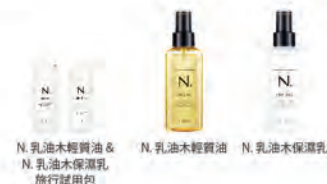
N. 乳油木輕質油 & N. 乳油木保溼乳 旅行試用包

N. 乳油木輕質油 NET.150mL 1050元 / N. 乳油木保溼乳 NET.150g 1050元 [旅行試用包] N. 乳油木輕質油 NET.7.5mLx24 2400元 / N. 乳油木保溼乳 NET.7.5g x24 2400元