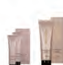
iM上質修護法 鉑金級居家護髮膜 NET.15g×2 280元/NET.80g 500元