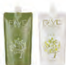
玢美森活感縮毛矯正燙髮劑H [強力型] 新生髮，嚴重自然捲適用(一般髮質) 1劑/2劑各NET.400g