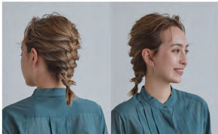
襯衫 / 造型師個人物品

能輕輕呈現色彩對比的編髮, 正是因為做了高亮度設計染才容易推薦的造型提案。 編髮時不用拉太緊, 大幅度隨性地編髮讓整體造型更加自然。