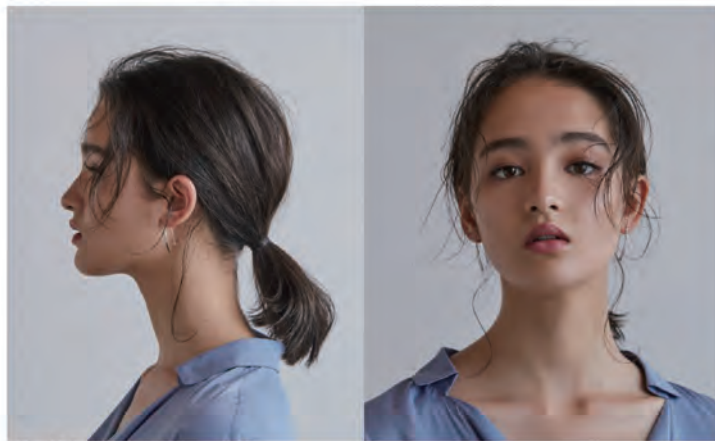
襯衫、耳環 / 造型師個人物品

簡單綁起來就很有型的低馬尾造型, 無論哪種髮質或髮長, 在各個場合都十分活躍。 為避免看起來不夠精緻, 用後頸四周垂落的髮絲營造氣質, 展現非凡的品味。