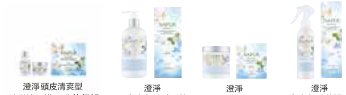
ナビュール センシティブバブル: [澄淨 敏感肌膚專用保潔泡泡] NET.50mL 300元 / NET.200mL 940元 ナビュール スキヤルピュミスト: [澄淨 頭皮清爽型 洗髮精 & 護髮乳 旅行組 澄淨 頭皮清爽型 洗髮精 澄淨 頭皮清爽型 護髮乳 澄淨 頭皮清爽型 養護噴霧]

[洗髮精] NET.300mL 900元 / NET.750mL 1800元 NET.700mL 補充包 1600元 [護髮乳] NET.250g 1100元 / NET.650g 2200元 NET.600g 補充包 1800元 [小包裝組合] 洗髮精 NET.50mL & 護髮乳 NET.50g 一組 480元