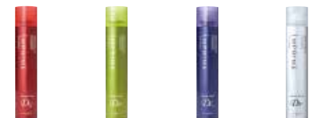
Design Gloss 水漾光感噴霧 Design Edge 蓬鬆空氣感噴霧 Design Lock 強力定型噴霧 Design Freeze 冰炫風定型噴霧