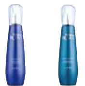
皇家藍鑽賦活精露 皇家翡翠綉色精露

皇家藍鑽賦活精露 NET.125mL 950元 / 皇家翡翠綉色精露 NET.125mL 950元