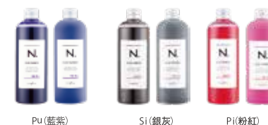
Pu(藍紫) Si(銀灰) Pi(粉紅)

該系列有針對高強度或漂後髮能夠抑制帶黃變色的「藍紫」，針對灰色・藍綠色系的既染髮能夠增添透感「銀灰」，抑制粉紅・紅色系既染髮的退色，能更長久維持水潤變色的「粉紅」3 款。添加乳油木果油 *1、黃金蠶絲萃取 *2 花椰菜油 *3 等天然萃取成分更能確實修護染後令人在意的髮質損傷。對講究染髮質感的您，特別提供 3 種染後專用補色洗髮精 & 護髮乳，作為今後每天的髮質呵護新習慣。