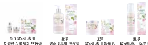
澄淨 敏感肌膚專用 洗髮精 & 護髮乳 旅行組 澄淨 敏感肌膚專用 洗髮精 澄淨 敏感肌膚專用 護髮乳 澄淨 敏感肌膚專用 保潔泡泡

澄淨居家洗護系列全產品皆使用珍貴稀少的有機仙人掌果油，以及取自新鮮葡萄的葡萄籽精油。不僅散發出療癒身心的香氣，更能帶給頭髮水潤光澤，打造出健全的秀髮質地。