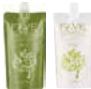
珐芙森活感縮毛矯正燙髮劑H [強力型] 新生髮, 嚴重自然捲適用(一般髮質) 1劑/2劑各NET.400g