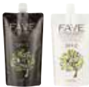
珐芙森活感縮毛矯正燙髮劑SH [超強力型] 新生髮, 嚴重自然捲適用(粗硬髮・疏水性髮質) 1劑/2劑各NET.400g

忠實呈現顧客心目中理想髮質的新概念縮毛矯正燙髮劑。能從髮根至髮尾確實拉直秀髮,呈現出令人忍不住想觸摸的柔滑觸感及光澤度。也是娜普茲所追求的“直順髮”的起始目標。