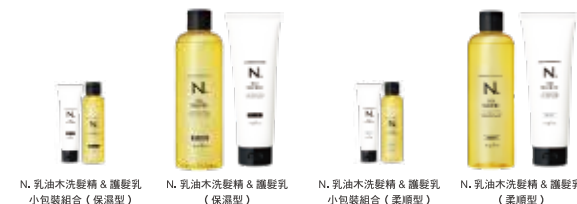
N. 乳油木洗髮精 & 護髮乳 小包裝組合 (保濕型) N. 乳油木洗髮精 & 護髮乳 (保濕型) N. 乳油木洗髮精 & 護髮乳 小包裝組合 (柔順型) N. 乳油木洗髮精 & 護髮乳 (柔順型)

[洗髮精] NET.300mL 1100元 / NET.750mL 2200元 NET.750mL 補充包 2000元 [護髮乳] NET.240g 1100元 / NET.650g 2400元 NET.650g 補充包 2000元 [小包裝組合] 洗髮精 NET.80mL & 護髮乳 NET.65g 一組 800元