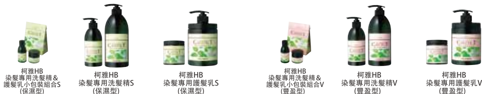
柯雅HB 染髮專用洗髮精&護髮乳小包裝組合S (保濕型) 柯雅HB 染髮專用洗髮精S (保濕型) 柯雅HB 染髮專用護髮乳S (保濕型) 柯雅HB 染髮專用洗髮精&護髮乳小包裝組合V (豐盈型) 柯雅HB 染髮專用洗髮精V (豐盈型) 柯雅HB 染髮專用護髮乳V (豐盈型)