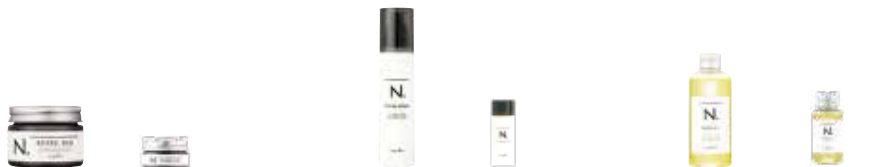
N. 全效果實蠟 NET.45g 820元 N. 全效果實蠟 NET.18g 400元