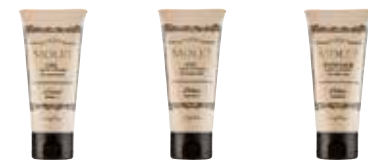
沫蕾隨心所欲水潤凝乳 沫蕾隨心所欲絲亮凝霜 沫蕾隨心所欲粉霧軟蠟