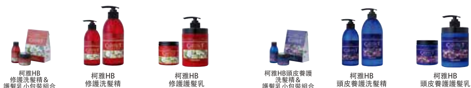
柯雅HB 修護洗髮精&護髮乳小包裝組合 柯雅HB 修護洗髮精 柯雅HB 修護護髮乳 柯雅HB頭皮養護洗髮精&護髮乳小包裝組合 柯雅HB 頭皮養護洗髮精 柯雅HB 頭皮養護護髮乳

最適合染後頭髮，含有色素配方的弱酸性洗髮精。加水分解玻尿酸成分，讓染後髮能得到溫柔的保護，並維持艷澤髮色。針對不同髮質，有保濕型(S)及豐盈型(V)可供選擇。在染髮後最初的兩三回使用染髮專用洗髮精&護髮乳，可抑制褪色，並同時去除多餘的污垢及不適的味道，為染髮後最適的專用產品。