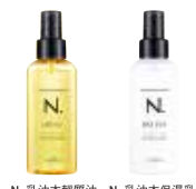
N. 乳油木輕質油 N. 乳油木保濕乳

N. 乳油木輕質油 NET.150mL 1050元 N. 乳油木保濕乳 NET.150g 1050元