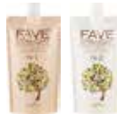
珐芙森活感縮毛矯正燙髮劑N [一般型] 燙後髮(髮中~髮尾)/輕微自然捲適用 1劑/2劑各NET.400g