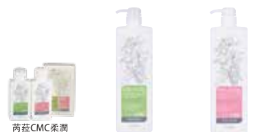
芮荳CMC柔潤洗髮精&護髮乳小包裝組合 芮荳CMC柔潤洗髮精 芮荳CMC柔潤護髮膜

芮荳CMC柔潤洗髮精 リラベール CMCシャンプー NET. 1000mL 1280元 業務用4000mL(補充包)NET. 1000mL x4) [小包裝組合] 洗髮精NET.120mL & 護髮乳NET.120g 一組 640元 芮荳CMC柔潤護髮膜 リラベール CMCヘアマスク NET. 1000g 1280元 業務用4000g(補充包)NET. 1000g x4)